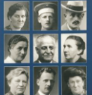
Jüdische Einwohner von Oberkotzau und Schwarzenbach an der Saale Schicksale und Verfolgung im Nationalsozialismus